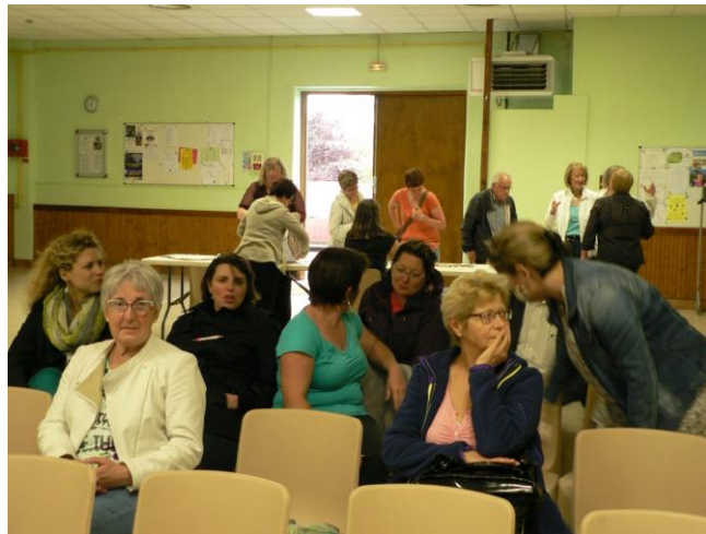
Une partie de l'assemblée en pleine discussion.