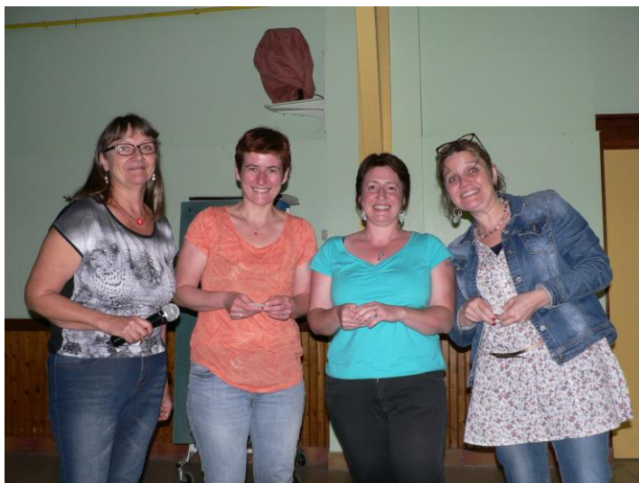
Une brochette des nageuses du Téléthon.

Comme à son habitude, l'Assemblée Générale s'est terminée par le pot de l'amitié.